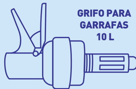
GRIFO PARA GARRAFAS 10 L